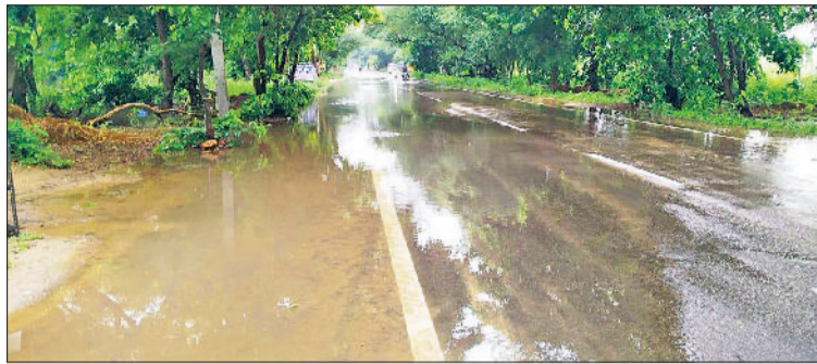
महेंद्रगढ़। रेवाड़ी-महेंद्रगढ़ रोड से गुजरता दोहान नदी का पानी।

मानसून में पानी की मांग कम होने से नहरों को 16 स्थानों पर इन नदियों से जोड़ा गया। नारनौल ब्रांच को डेरोली अहीर के पास लगभग 300 सीएस का एस्कैप दोहान नदी में दिया गया