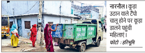
नारनौल। कूड़ा उठान वाले टैपो चालू होने पर कूड़ा डालने पहुंची महिलाएं।