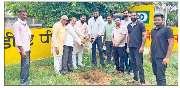
नारनौल। बलाहा कलां में पौधारोपण करते हुए।

पैक्स बलाहा कलां व कोऑर्पेटिव बैंक बलाहा कलां की ओर से कार्यालय परिसर में अंतर राष्ट्रीय सहकारिता वर्ष के रूप में मनाया गया। जिसके अंतर्गत वीरवार को पौधारोपण किया गया। पर्यावरण में बढ़ते प्रदूषण की वजह से पौधारोपण की आवश्यकता इन दिनों अधिक हो गई है। पौधारोपण से तात्पर्य पेड़ों के विकास के लिए पौधों को लगाना और हरियाली को फैलाना है। पर्यावरण के लिए पौधारोपण की प्रक्रिया महत्वपूर्ण क्यों है, इसके कई कारण हैं। मुख्य कारणों में से एक कारण यह है कि