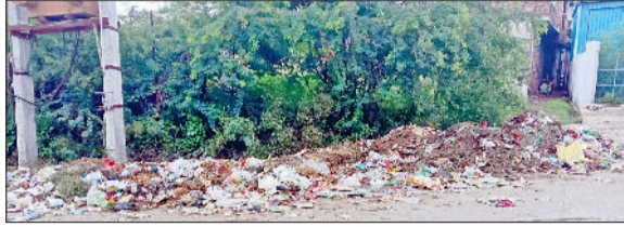
नारनौल। सीआईए रोड अंडरपास के पास लगे गंदगी के ढेर।

शुक्रवार से शहर में पुनः नियमित सफाई एवं कूड़ा उठान का कार्य हो सकेगा। इससे नगर परिषद एवं शहरवासियों को जरूर राहत मिल सकेगी।