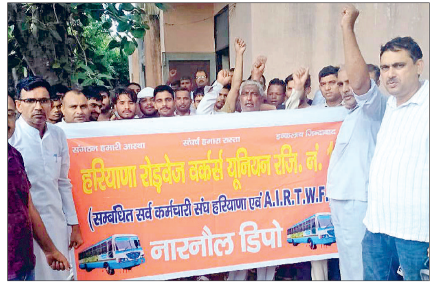
नारनौल। रोडवेज में प्रदर्शन करते कर्मचारी।