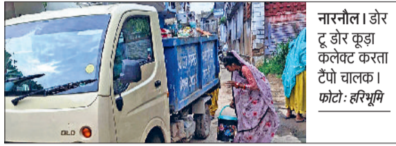
नारनौल। डोर टू डोर कूड़ा कलेक्ट करता टैपो चालू।