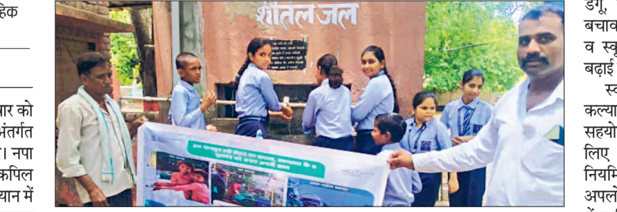
कनीना। स्वच्छता अभियान के तहत स्कूल में हैंडवाश के करते विद्यार्थी।