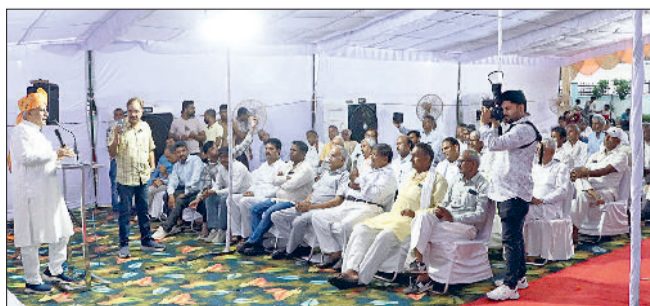
नारनौल। जनसभा को संबोधित करते जनस्वास्थ्य एवं पीडब्ल्यूडी मंत्री रणबीर सिंह गंगवा।

हरियाणा के जनस्वास्थ्य एवं पीडब्ल्यूडी मंत्री रणबीर सिंह गंगवा ने वीरवार को रेस्ट हाउस में आयोजित जनसभा में संबोधित करते हुए कहा कि मुख्यमंत्री नायब सिंह सैनी के कुशल नेतृत्व में हरियाणा सरकार संतों व महापुरुषों के विचारों को जन जन तक पहुंचाने और उनके आदर्शों को नई पीढ़ी तक प्रसारित करने के लिए प्रतिबद्ध है। उन्होंने बताया कि इसी प्रतिबद्धता में 13 जुलाई को भिवानी में एक भव्य राज्य स्तरीय महाराज दक्ष प्रजापति समारोह का आयोजन किया