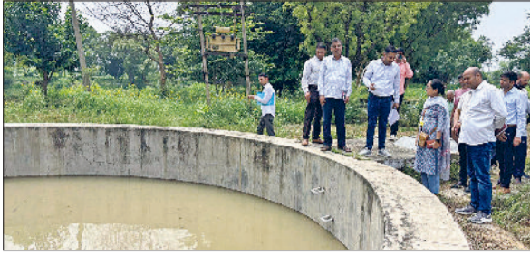
नारनौल। गांव बड़कोदा में जल जीवन मिशन व जल शक्ति अभियान के तहत निरीक्षण करती केंद्रीय टीम।

उपायुक्त डॉ. विवेक भारती ने कहा कि जलशक्ति और जल जीवन मिशन जल संसाधनों के प्रबंधन तथा सभी को स्वच्छ पेयजल उपलब्ध कराने के सरकार के महत्वपूर्ण कार्यक्रम हैं। इन कार्यक्रमों से जिला महेन्द्रगढ़ में जल स्तर में ऐतिहासिक सुधार हुआ है। डीसी वीरवार को लघु सचिवालय में केंद्रीय जल शक्ति मंत्रालय से आई टीम तथा जिले के अधिकारियों की बैठक में बोल रहे थे। डीसी ने बताया कि जलशक्ति मंत्रालय का गठन मई 2019 में किया